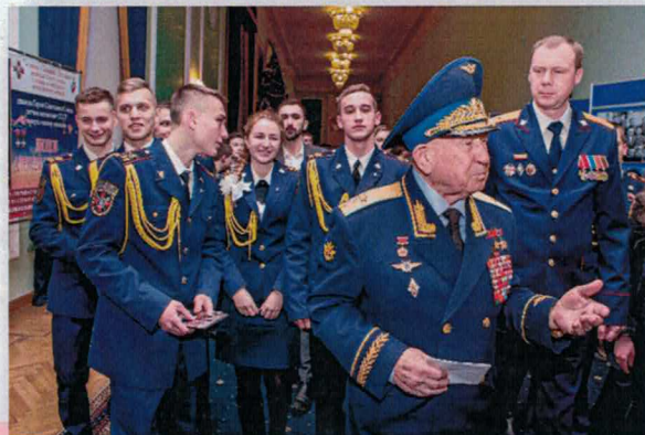
А.А. Леонов на встрече с кадетами

Полет состоялся 15 июля 1975 года — первопроходцами были советский корабль «Союз-19» и американский корабль «Аполлон». Нил Армстронг – первый человек, ступивший на Луну, первый космический турист Дэннис Тито.