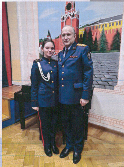
Поздравление с юбилеем Кадетского корпуса имени Александра Невского

Кадетский корпус - 10 лет в строю, Тебя я искренне и преданно люблю И сколько не минуло в твоей жизни лет, Тебя ждёт множество успехов и побед!